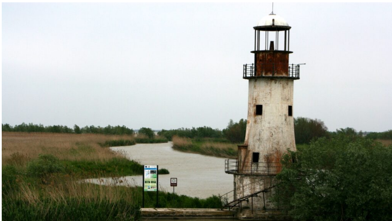
Das Donaudelta bei Sulina